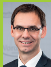
Mag. Markus Wallner Landeshauptmann

Wir wünschen Ihnen einen erholsamen und fröhlichen Familiensommer 2023!